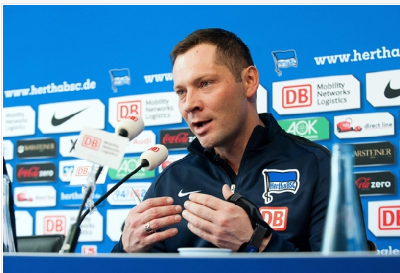
Egy berlini Pécsről