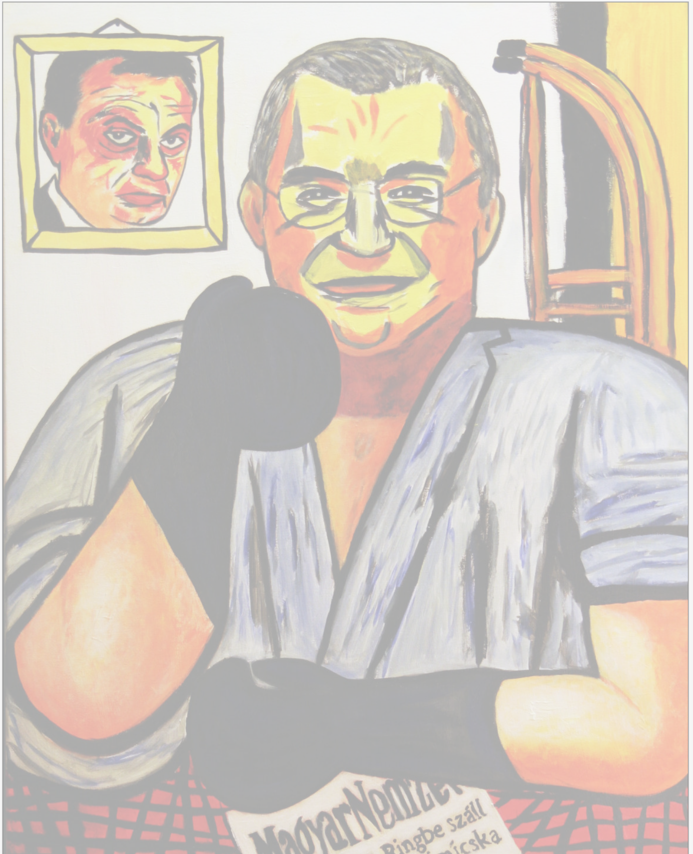
Simicska ringbe száll. Drmáriás festménye

Simicskák pedig 2001-ben vették bérbe a most árverésre hirdetett állami földeket, még az első Orbán-kormánytól, 50 évre, a mostani piaci árnál jóval